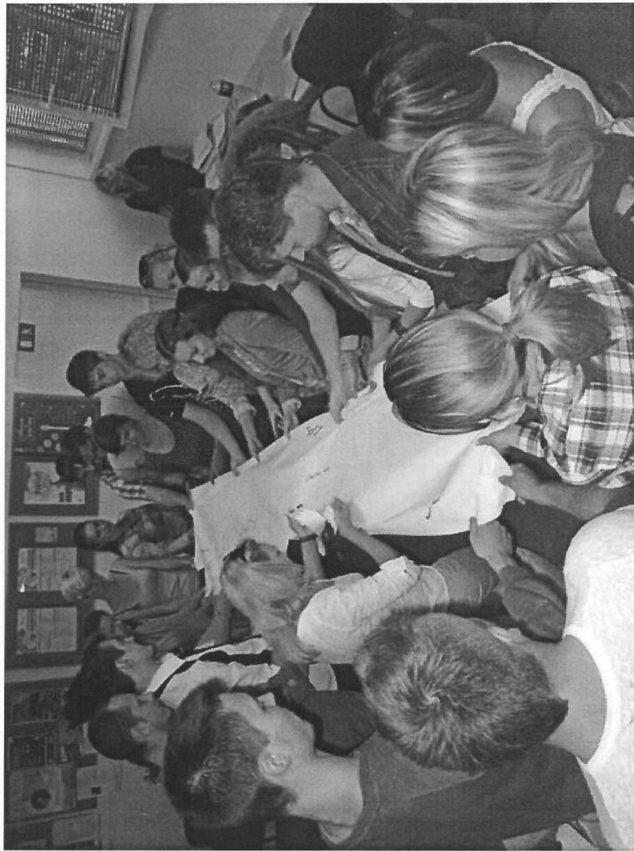
VšĮ „Media orbis“ su Lietuvos darbo birža buvo įgyvendintas projektas „Jaunų bedarbių karjeros valdymo kompetencijų tobulinimas naudojant inovatyvius metodus“.

Užsienio reikalų ministerijos parengtą „Media orbis“ su Lietuvos verslo ir žiniasklaidos bendradarbiavimo susitarimą buvo įgyvendintas projektas „Jaunų bedarbių karjeros valdymo kompetencijų tobulinimas naudojant inovatyvius metodus“.